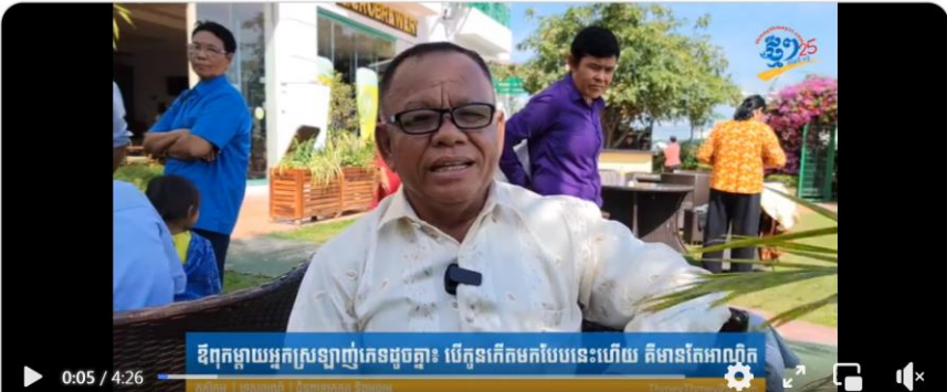
ឪពុកម្តាយអ្នកស្រឡាញ់ភេទដូចគ្នា៖ បើកូនកើតមកបែបនេះហើយ គឺមានតែអាណិត

https://www.facebook.com/share/v/nWHpLS1yJzRXaYRu/?mibextid=Le6z7H&startTimeMs=2000