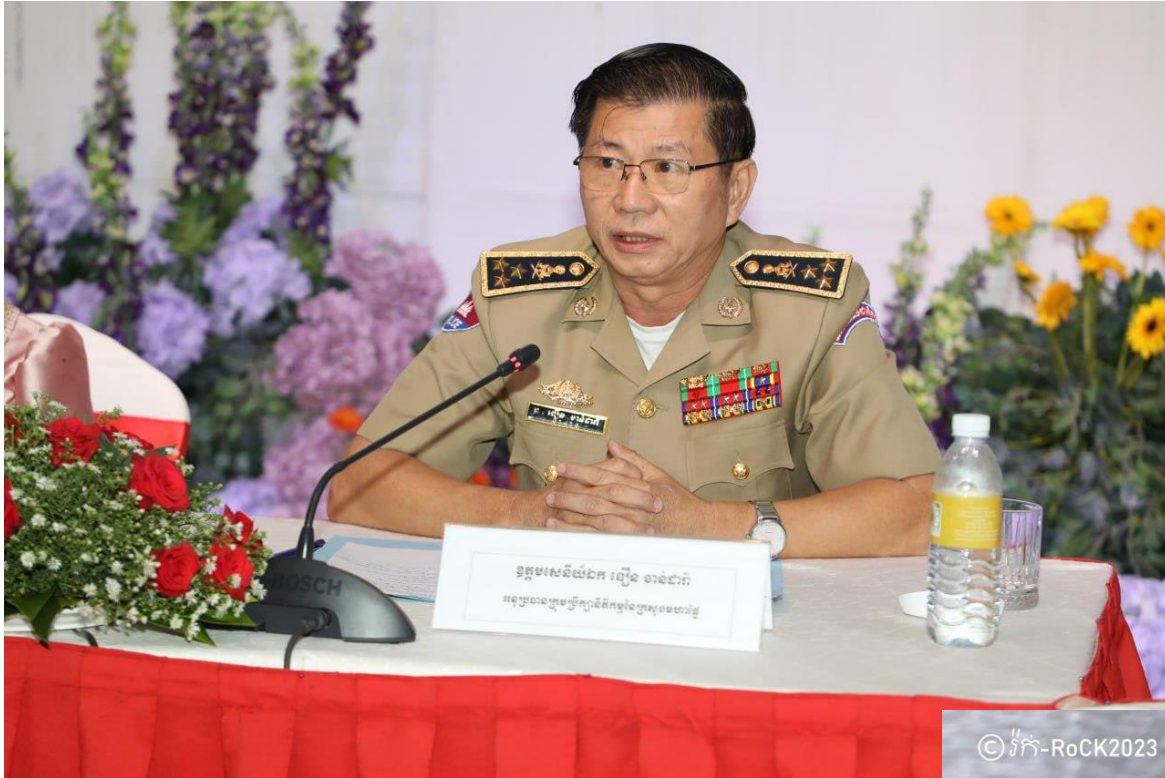
ឯកឧត្តមឧត្តមសេនីយ៍ឯក ខឿន ចាន់ដារ៉ា អនុប្រធានក្រុមប្រឹក្សានីតិកម្ម នៃក្រសួងមហាផ្ទៃ